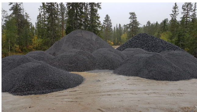
130 lass med grus er nå lagt i deponi ved Våt vatn, klar for utkjøring.