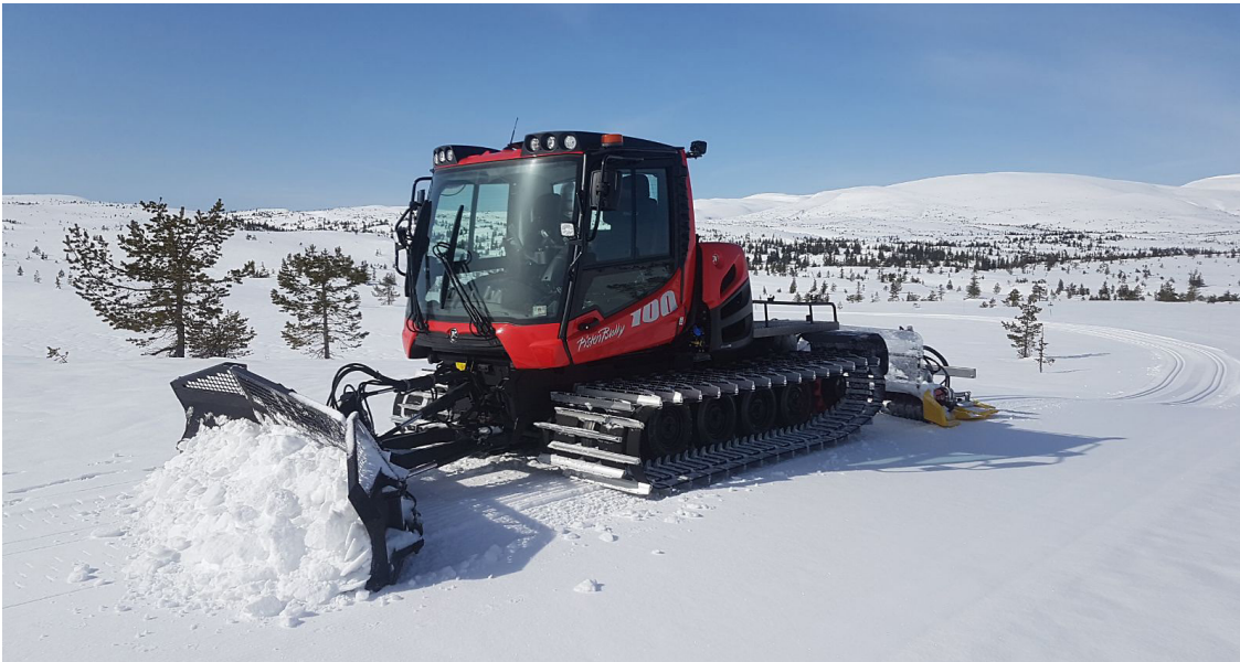
Den nye løypemaskinen til Nordre Ble løypeforening.